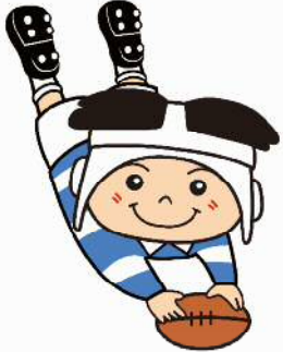
ラグビーのまち東大阪 マスコットキャラクター 「トライくん」