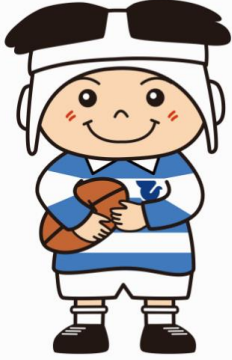
ラグビーのまち東大阪 マスコットキャラクター 「トライくん」