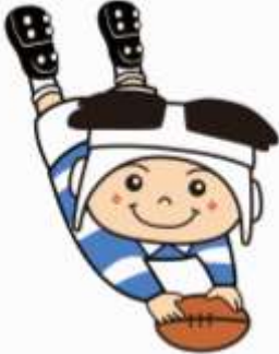
ラグビーのまち東大阪 マスコットキャラクター 「トライくん」