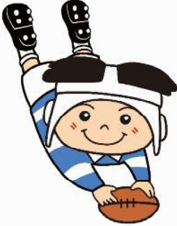
ラグビーのまち東大阪 マスコットキャラクター 「トライくん」