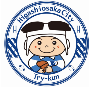
東大阪市マスコットキャラクター 「トライくん」