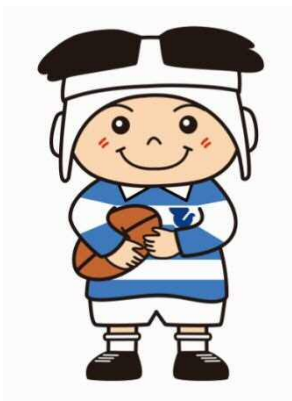
ラグビーのまち東大阪 マスコットキャラクター 「トライくん」

この採用試験は、「障害者の雇用の促進等に関する法律」の趣旨に基づき、障害者の雇用の促進を図ることを目的として実施します。