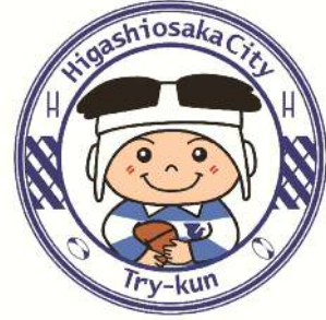
東大阪市マスコットキャラクター 「トライくん」