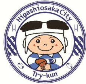
東大阪市マスコットキャラクター 「トライくん」