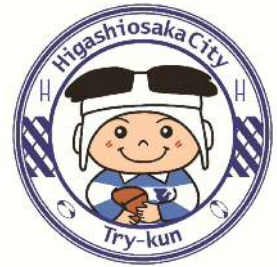
東大阪市マスコットキャラクター 「トライくん」