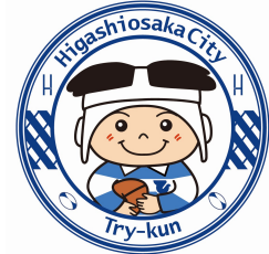
東大阪市マスコットキャラクター 「トライくん」