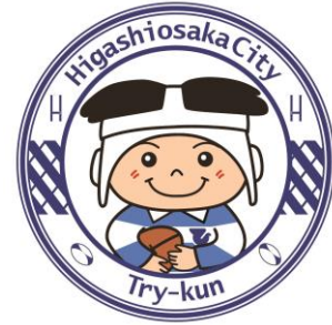
東大阪市マスコットキャラクター 「トライくん」