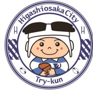
東大阪市マスコットキャラクター 「トライくん」