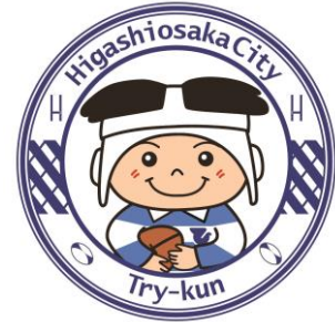
東大阪市マスコットキャラクター 「トライくん」