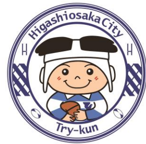
東大阪市マスコットキャラクター 「トライくん」