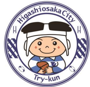
東大阪市マスコットキャラクター 「トライくん」