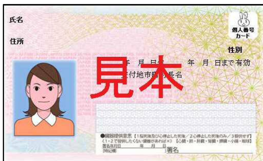
↑ 個人番号カード(見本)